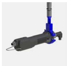
V-blocksfäste för pistol- eller vinklade maskiner