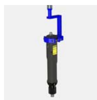
V-blocksfäste för raka skruvdragare